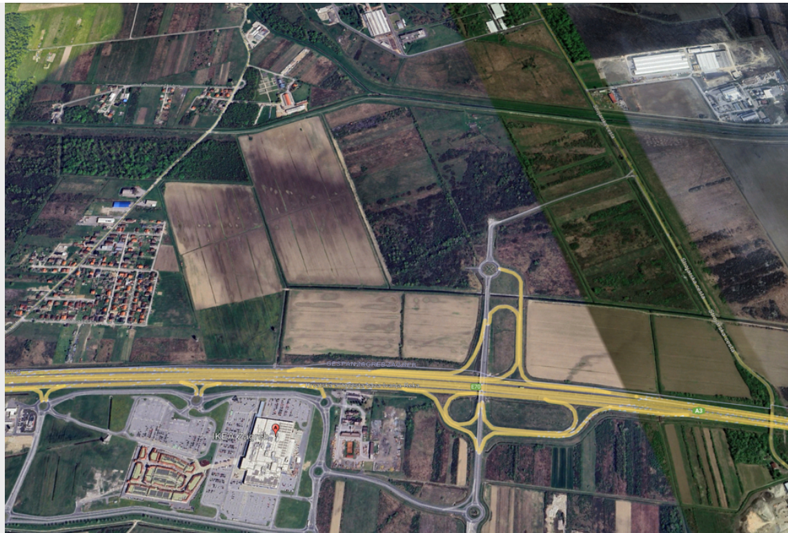
10360 Zagreb (Kroatien)